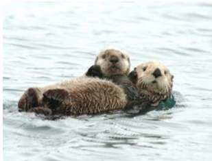
Lekti Fanmi ak Matematik lanwit Yon "Otterly" Evènman Etonan