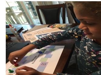
Lekti Fanmi ak Matematik lannwit

Nap mande Paran ak Fanmi yo pou yo konplete yon Sondaj Enterè ki endike sou ki topik yo ta renmen plis enfòmasyon., tan konvenyan pou yo vizite lekòl la, ak konpetans yo ta renmen pataje avèk klas la (ex: yon vizite kap li nan klas la, patisipe nan yon reyinyon WCBOE), Nap voye yon sondaj volontye lakay avèk opòtinite pou yo pataje koman yo ta renmen sipòte lekòl la. Enfòmasyon nan sondaj sa yo ap sipòte efò lekòl la poul travay avèk fanmi yo kòm patnè legal.