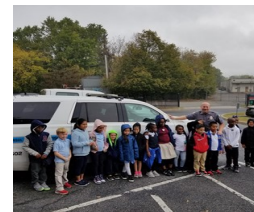
Depatman Lapolis Salisbury ak Majistra Day